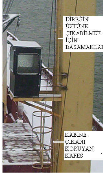
Resim 5: Direk çıkış basamakları

Gemilerde direklere, kreynlere ve kasaralara 37 yükseğe çıkabilmek için vardevela ve basamaklar konur. (Resim-5) Bu vardevela ve basamaklara tutunarak ve basarak yükseğe tırmanılır. Ancak bunların bakımı zor ve ince olduklarından kolayca yıpranıp kırılabilirler. Üstelik boya nedeni ile gözükmediklerinden tehlike yaratırlar. Bu neden ile vardevelalar zaman zaman kontrol edilmelidir.