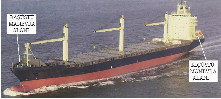
Resim 1:-Başüstü ve kıçüstü manevra yerleri

Halat manevrası ise sabit bir yere bağlanmış halatı varken, geminin makinelerine güç verilerek geminin pozisyonunu değiştirme işleminin yapılmasıdır.