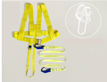
Resim 4: Emniyet kemeri

Yüksekte bizi düşmelerden koruyacak en önemli teçhizat emniyet kemeridir. Emniyet kemeri, üzerindeki kilit ve kancaların güvenli yerlere takılması ile takanı güvenceye almaya yarayan bir kemerdur. (Resim-4)