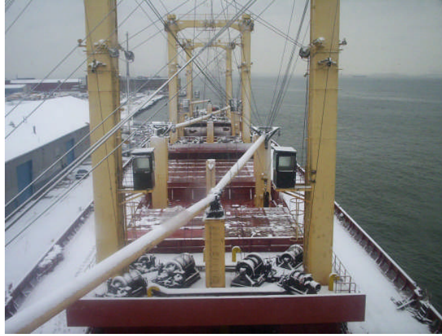
Resim 2- Kar ile kayganlaşmış güverte

Ve tüm bunlar güverteyi kayganlaştırıp üzerinde dolaşan insanların düşmesine, yaralanmasına, sakatlanmasına ve hatta ölmesine sebep olabilir. Hele gemi sacdan33 yapılmışsa ki bugün gemilerin hemen hemen tamamına yakını sacdan yapılmıştır, bunlarda düşülecek sac zemin riski daha da yükseltmektedir.